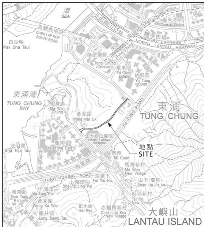
比例 SCALE 1:20 000