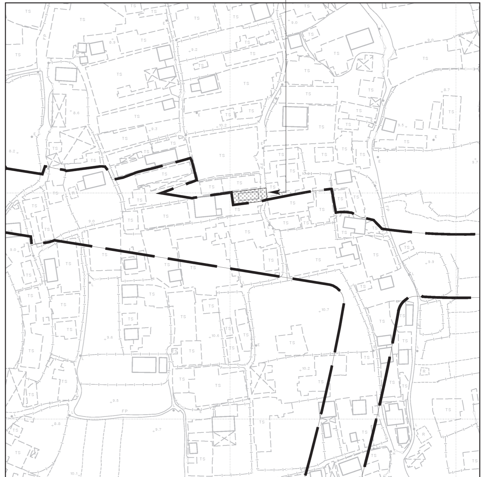
圖 A MAP A

在圖則編號YLM10745(第五張)上顯示的收地 / 清拆範圍須予縮減。 The extent of land resumption / clearance shown on Plan No. YLM10745 (Sheet 5) shall be reduced.